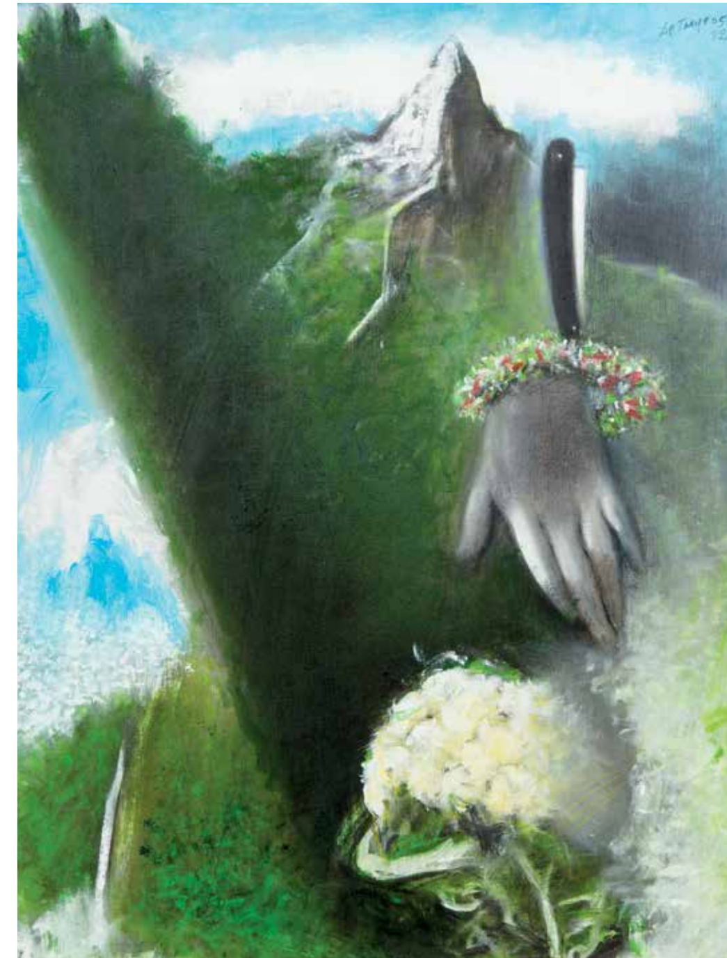
Peinture 2005 / 2012 Acrylique sur toile 80 x 60 cm