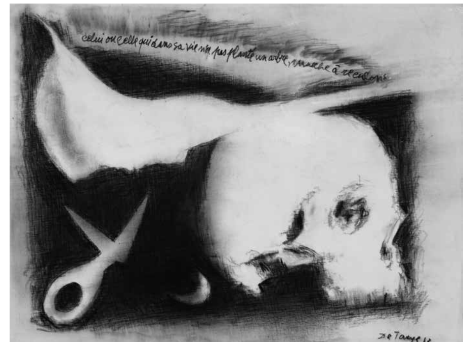
Peinture 2013 Acrylique et crayon sur toile 30 x 40 cm