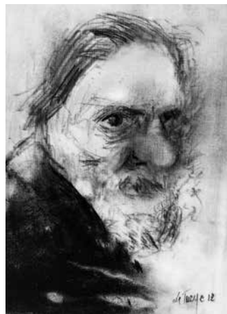
Autoportrait 2012 Crayon sur toile 30 x 21 cm

Les verts cru et les bleus turquoise dominant, magnifiés par le noir et blanc qui délie tensions et violences, les confie aux brumes du passé. Les compositions obliques, les équations insensées et contre nature, les flashes d'objets, le vocabulaire éclaté par l'intuition de la fin prochaine montent une dernière fois au créneau, avec une verueur impressionnante. La facture délivrée de l'esprit de système joue ses acquis et s'aventure à la lisière de l'inconnu. Une dernière fois, le peintre jonche son chemin des noirs pétales de son existence. Un tomber de rideau qui, en conviant le vocabulaire familier des couteaux, ciseaux, chevaux, bouleaux, poireaux et autres crânes, sexes, bois, montagnes, moutons, vaches et plumes, confirme la grandeur du dessinateur, l'alchimie sans précédent du trait et de la couleur. Réminiscences, autocitations, incursions au-delà du miroir baignent dans une mélancolie certaine ; les grincements de la scie s'apaisent. Camille De Taeve quitte la scène et il le sait. La silhouette d'homme qui s'éloigne à contre-jour est un adieu discret et les autoportraits, parfois saisissants, jouent sa mort prochaine. Cette première exposition posthume essentiellement dédiée aux travaux de 2012 et 2013 et à quelques œuvres fortes des années précédentes, souligne l'humeur âcre existentielle de l'œuvre dans une belle, vive et paradoxale lumière de printemps.