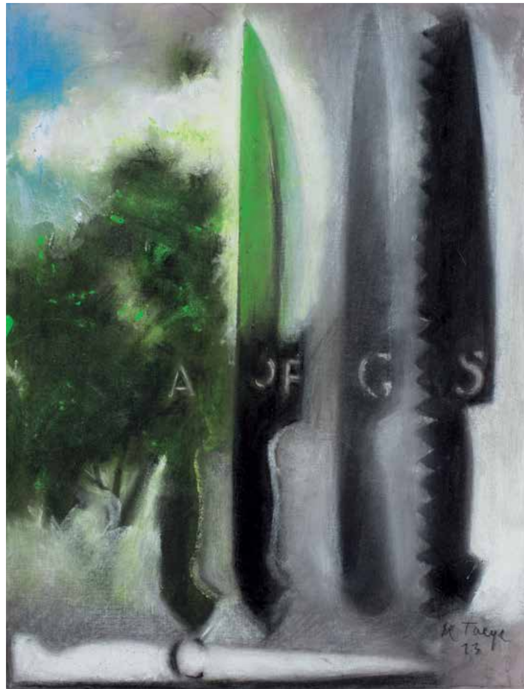
Peinture 2013 Acrylique et crayon sur toile 40 x 30 cm