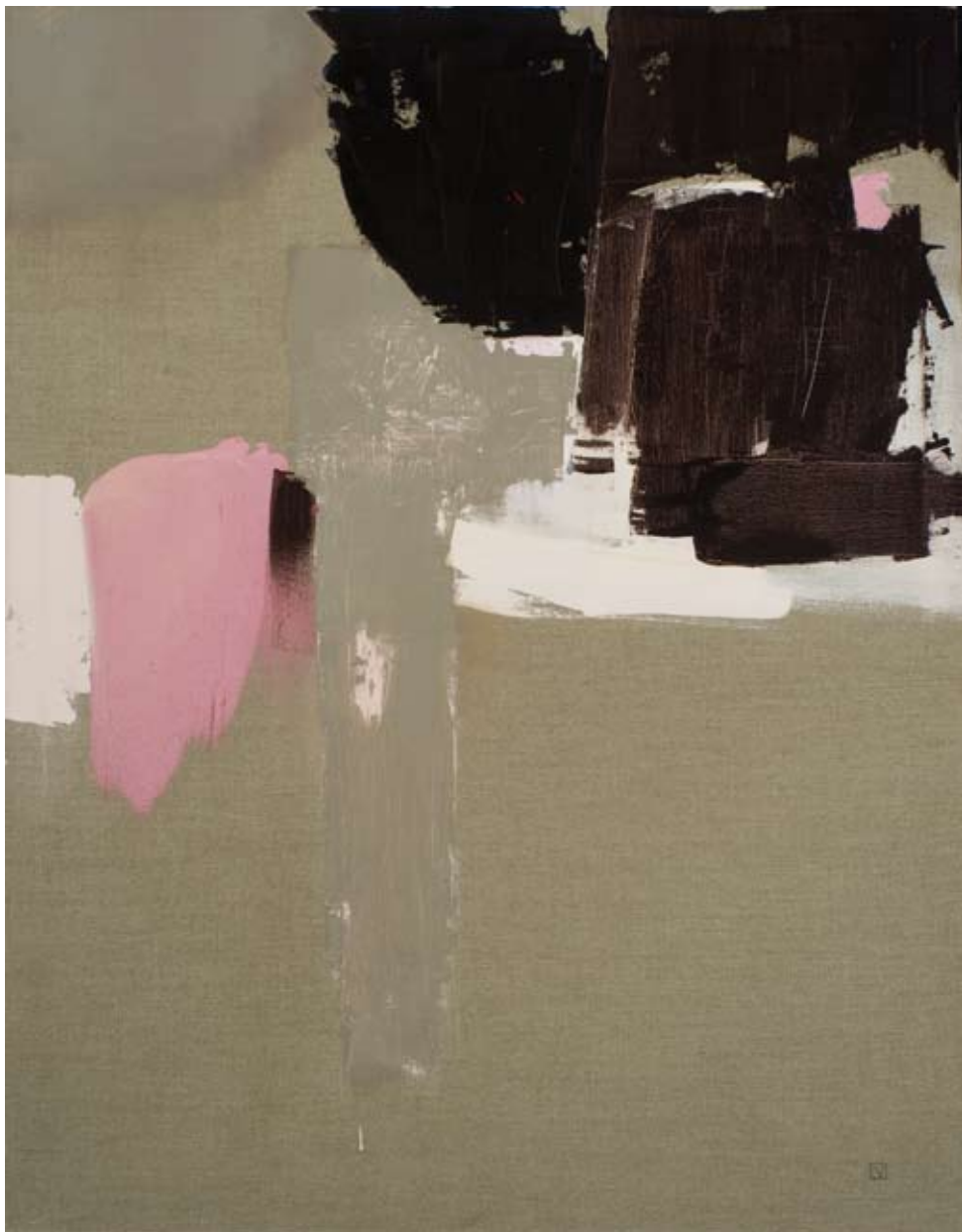
Istanbul I , acryl sur toile, 130 x 100 cm