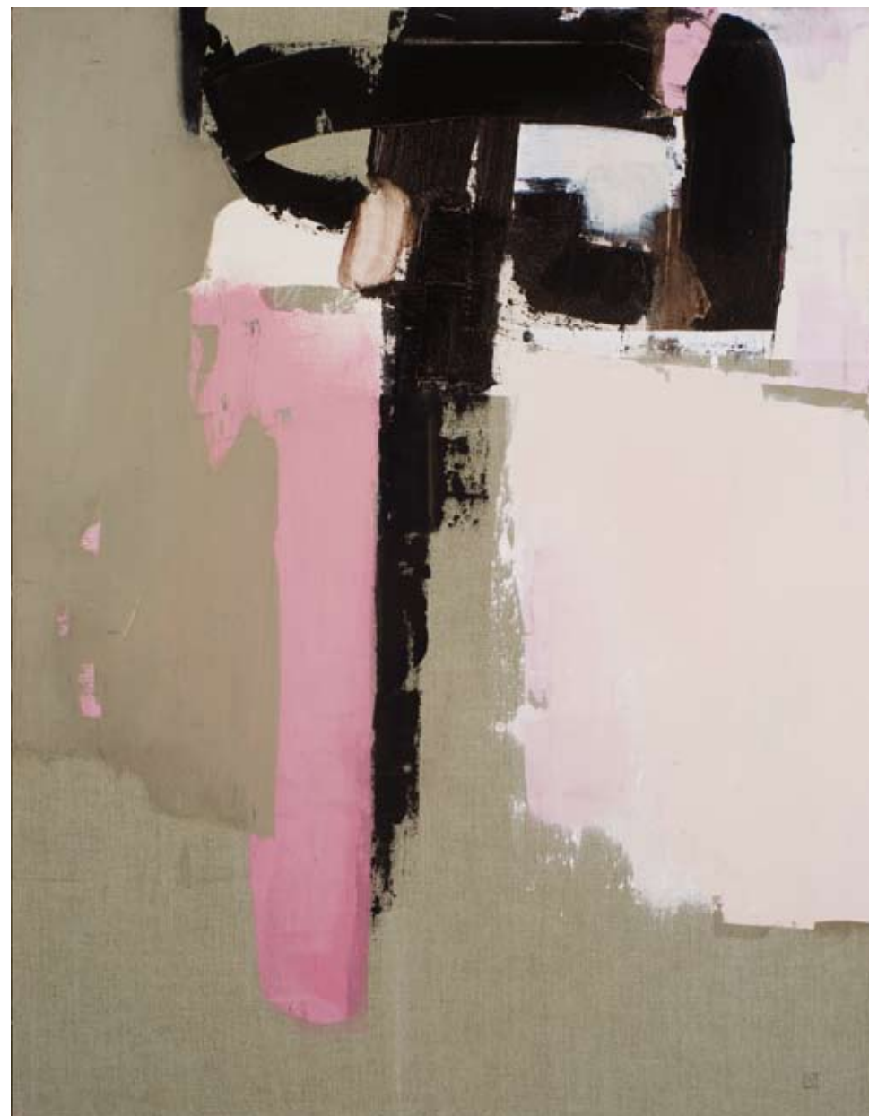
Istanbul II , acryl sur toile, 130 x 100 cm