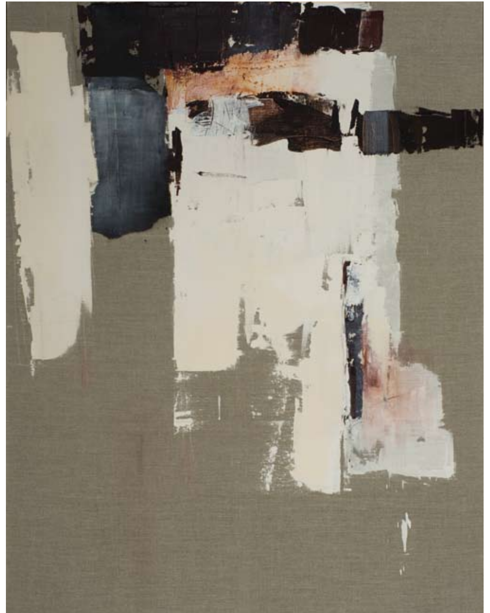
Kalad I , acryl sur toile, 150 x 110 cm