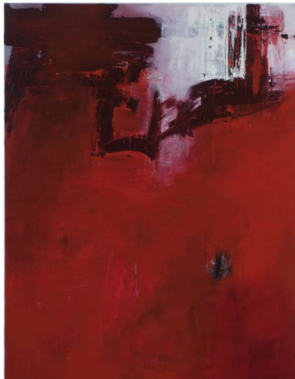
Purpura , 2009, acryl sur toile, 150 x 110 cm

Site internet : www.charlottevindevoghel.com