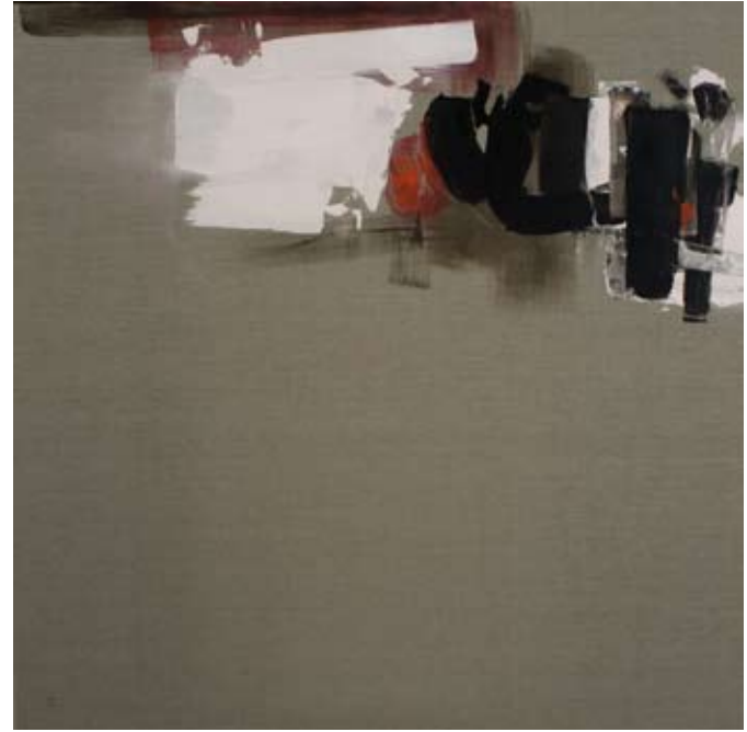
Istanbul IV , acryl sur toile, 150 x 150 cm