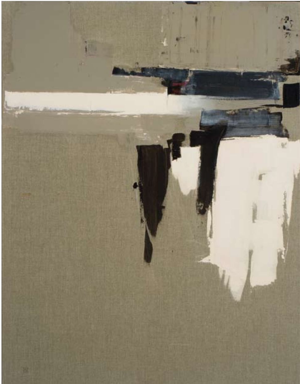
Kalad II , acryl sur toile, 130 x 100 cm