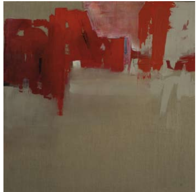
Venise I , acryl sur toile, 150 x 150 cm