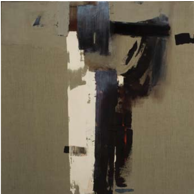
Dakal II , acryl sur toile, 150 x 150 cm