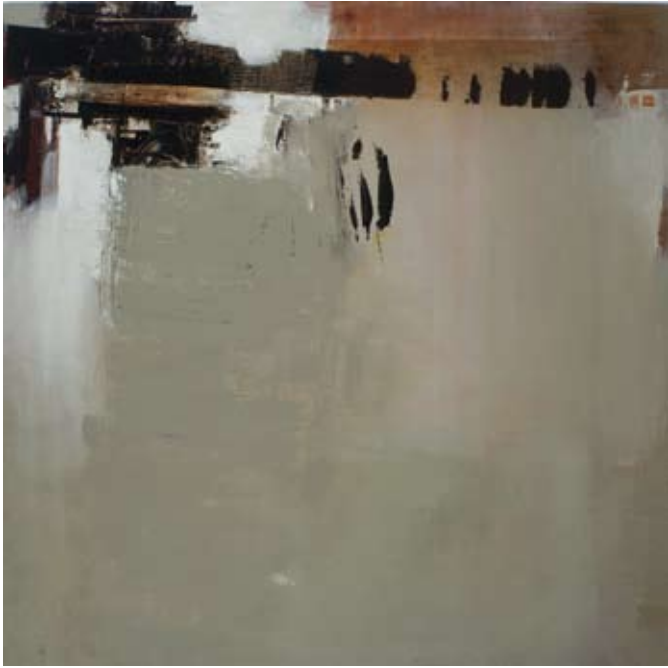
Kala , acryl sur toile, 150 x 150 cm